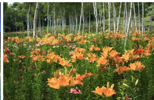
花の里(富士見高原)